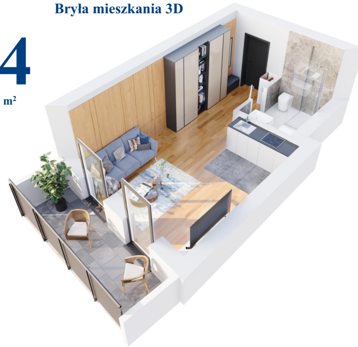
Bryła mieszkania 3D